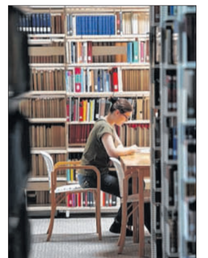
Nach dem Bachelor weiter studieren: Die meisten Studenten entscheiden sich dafür.

Haben die Bachelor-Absolventen aber genug vom Studieren, finden die meisten von ihnen innerhalb von sechs Monaten nach dem Abschluss einen Job. Die Arbeitslosigkeit liegt bei zwei bis drei Prozent. Was die Einstiegsgehälter betrifft, gibt es deutliche Unterschiede. „Bachelors der Informatik oder Ingenieurwissenschaften starten mit rund 36 000, 37 000 Euro brutto im Jahr“, sagt Briedis. Wirtschaftswissenschaftler mit 35 000 und Geisteswissenschaftler eher mit 25 000 Euro. ac