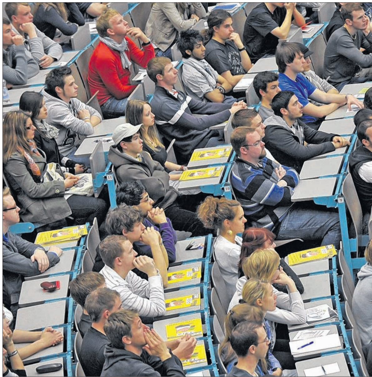
Voller Uni-Hörsaal: Im Bachelor-Studium sollten gute fachliche und methodische Kenntnisse erworben werden.

Aus Sicht Fleur Kemmers betrifft diese Debatte ihren Studiengang nicht, in dem Geld und Wirtschaft von den ersten um 600 v. Chr. geprägten Münzen bis zum Ende des weströmischen Reiches kurz vor 500 n. Chr. erforscht werden. „Unser Studienprogramm besteht zur Hälfte aus Veranstaltungen der AGRP, wodurch unsere Studierenden auch Erfahrung in der Ausgrabungspraxis sammeln. Damit sind